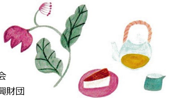
イラストレーション 松尾ミユキ (かぞくのじかん VOL.57) 無断転載・使用はお断りしています。